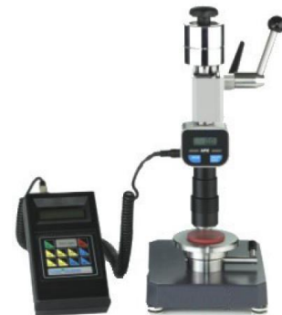
Figura 14. Durimetru Barcol cu stand

Firma producatoare: Heinrich Bareiss An fabricatie: 2017 Model: HPE II Echipament utilizat pentru determinarea duritatii rasinilor, materiale compozite cu matrici polimerice armate cu fibre (carbon, kevlar, bor, sticla,...) Echipament dotat cu stand de testare