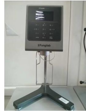
Figura 6. Vascozimetru