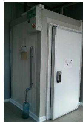
Figura 5. Camera frigorifica