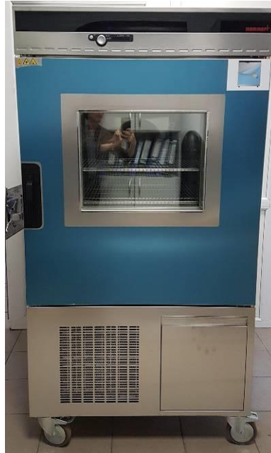
Figura 12. Camera climatica