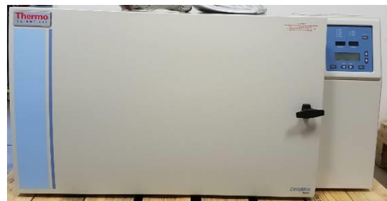
Figura 13. Echipament de testare in domeniul criogenic

Firma producatoare: VWR An fabricatie: 2017 Capacitate: 48 L Domeniu de temperatura: +50 ... -180 °C Afisaj LED Alarma auditiva si vizuala Material: inox si otel acoperit cu epoxi Include vas stocare in presiune azot lichid Capacitate vas azot: 60 L Rata evaporare: 2.01%/zi