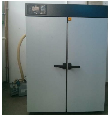
Figura 3. Etuva POL EKO SLN 240

Viteza nominala de pompare: max 2,2 m 3 / h