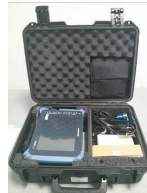
Figura 10. NDT OMNISCAN SX

Echiptament dotat cu soft si cabluri pentru conectarea la PC, geanta de transport si manual