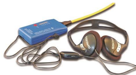
Figura 11. Detector scapari de vid