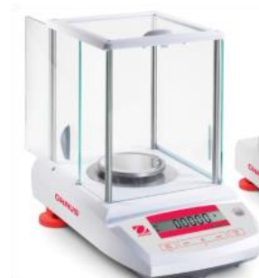
Figura 15. Balanta analitica

Conditii de stocare: -40°C ... 70°C la 10% pana la 80% umiditate relativa, fara condens