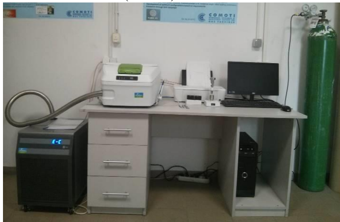
Figura 4. DSC 8000