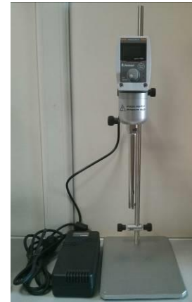
Figura 7. Agitator mecanic

Este utilizat pentru omogenizarea, amestecarea si pregatirea probelor pentru diverse aplicatii in domeniul biotehnologiei, farmaceutic, al cosmeticelor, industria alimentara, industria medicamentelor, industria petrochimiei, a lacurilor si vopselelor etc.