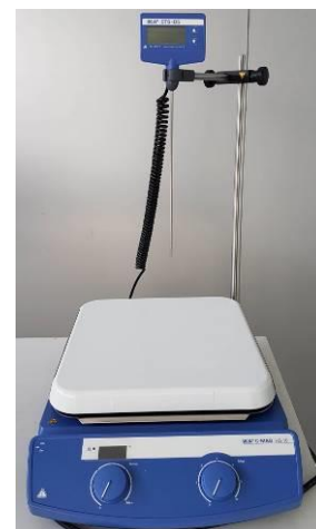
Figura 8. Agitator magnetic cu plita