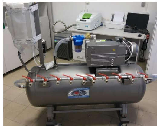
Figura 2. Echipamentul VARTM