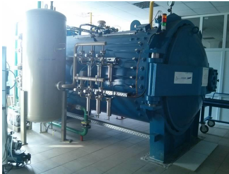
Figura 1. Autoclava SCHOLZ

Echipeamente conexe: Compresor 25 bari, Uscător, Turn de răcire-bazine de apă.